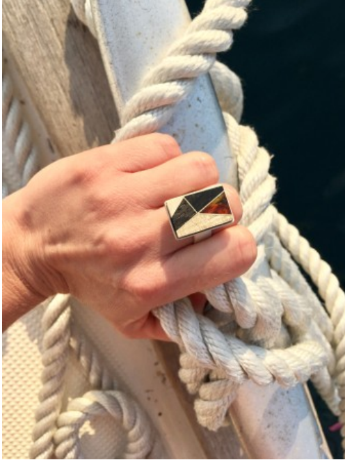
Ring aus der New Geometry Collection